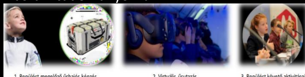
1. Repülést megelőző űrhajós képzés

A SpaceBuzz program a gyerekeket felkészíti és elviszi egy virtuális űrutazásra, melynek során új és hatékony oktatási módszeren keresztül ismerkednek meg a világgal, a Földdel és a műszaki tudományokkal.