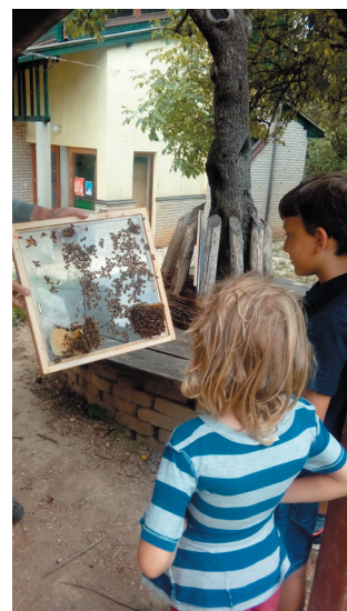
A vizsgálóláda kiegészül egy további kerettel