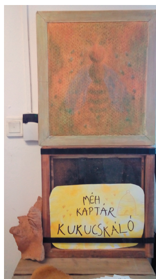
Méhkaptár-kukucskáló az iskola adventi bazárján.