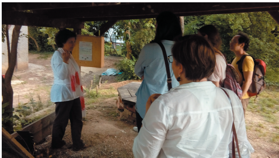
A szülői est a vizsgálóláda megtekintésével kezdődik.

Ahol korábban a táplálékuk volt, azaz üres tér volt a ládában, azt mindet maguktól teleépítették léppel. Gyönyörű formák ala-