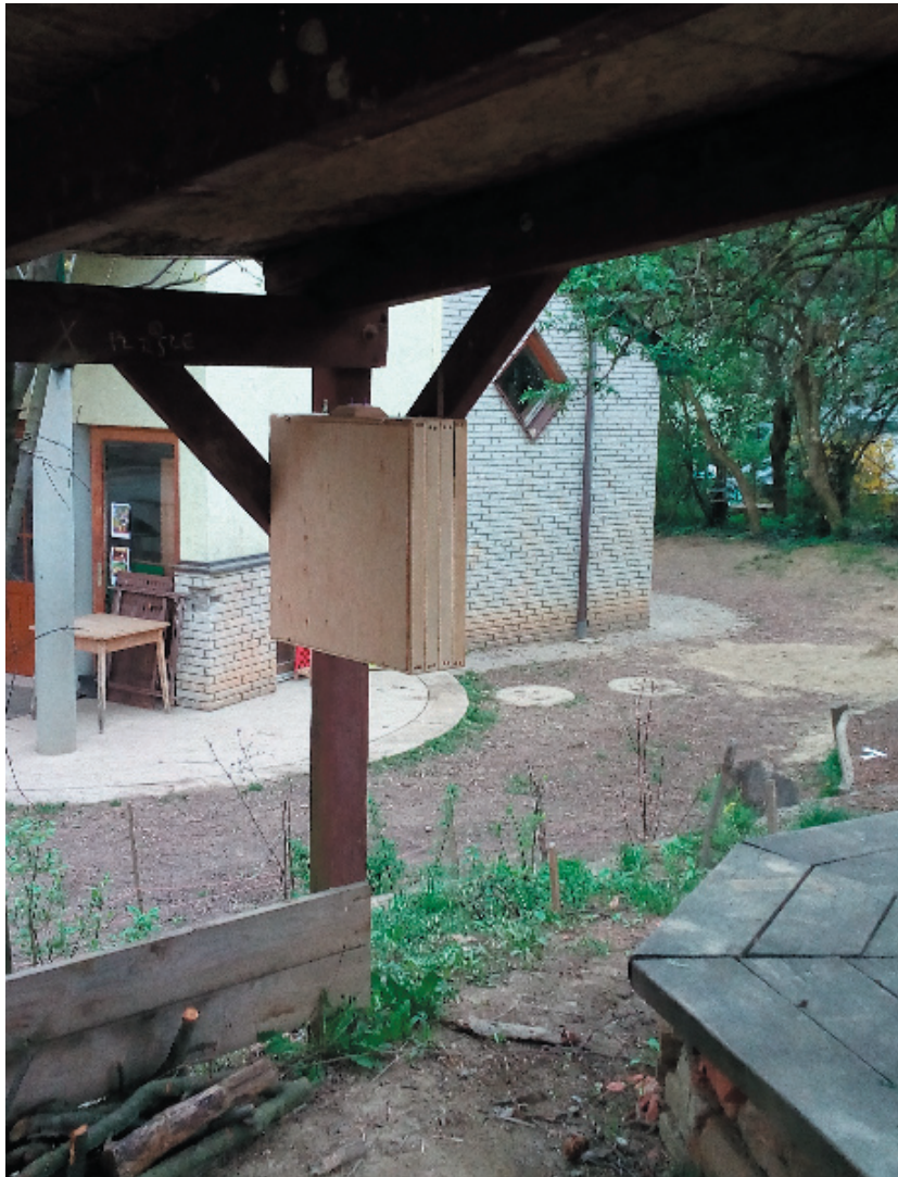
Vizsgálóláda a Pesthidegkúti Waldorf Iskolában

A pályázó intézmény neve és címe: Pesthidegkúti Waldorf Iskola (1028 Budapest, Kossuth u. 15-17.)