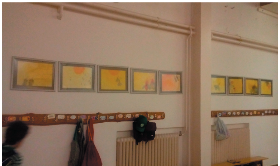
A 2. osztály festményeinek kiállítása az aulában, melyeket a méhek életéről olvasottak ihlettek.