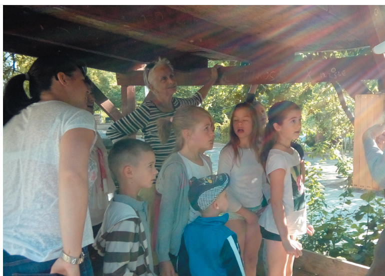
A megismerési úton lépegetve, tapasztalatokat gyűjtve tanultak a gyerekek és a felnőttek a méhekről.

A királynő a fiasítás kikelte után újra petéket rakott, aminek a fo-